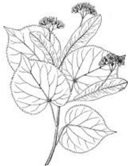
a kislevelű hárs hajtása

A temetődombi fa kislevelű hárs. A faj Európában, és azon belül Magyarországon is honos. Tölgygel, gyertyánnal összefogva nagy területeket