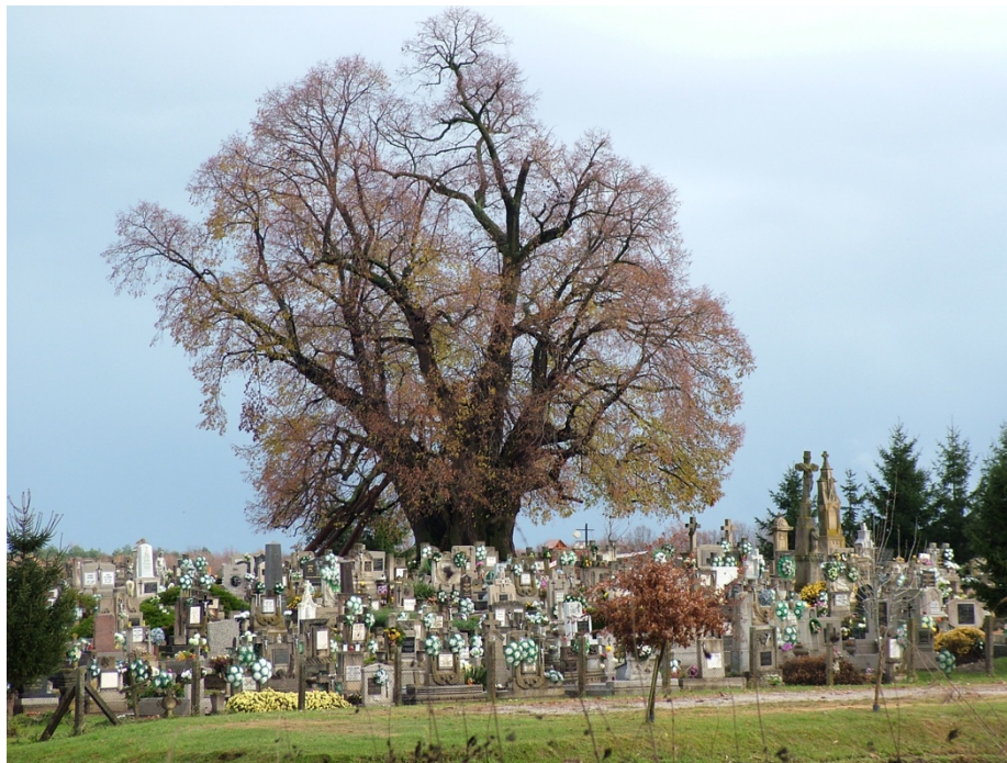
a szőkedencsi hárs a Temető-dombon

Híres még bajmóci társa, mely alatt egykor Mátyás pihent és egy okmány tanúsága szerint II. Rákóczi Ferenc fejedelem címzett oklevelet, ilyen formán: „Datum sub tilia nostra Bajmocziensis”. A Felvidéken álló, beteges, nagy öreg átmérőjét már meg sem lehet mérni. Talán a legnagyobb fatestvér a németországi Heedeben él. Korát csupán 500-650 évre becsülik, de körmérete hatalmas, 16 méter.