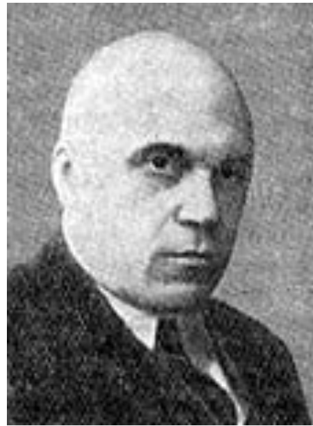
Rapaics Raymund, a képet a világhálóról töltöttem le

Baumgartner-díjjal jutalmazták 1937-ben. Ekkor meg József Attila sértődött meg, mert Babits Mihállyal, a díj fő ítéletozójával való rossz kapcsolata ellenére, ebben az évben számított a kitüntetésre, no meg a velejáró szép summára. Hát így szomorította el a Kertész leszek költőjét, a Magyarság virágai szerzőjének elismerése.