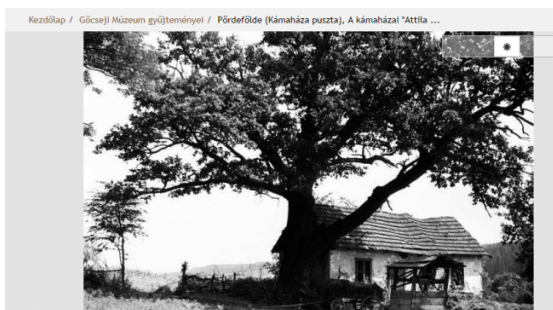
Pördefölde (Kámaháza puszta), A kámaházai "Attila tölgyfa"