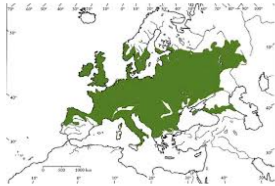
kocsányos tölgy elterjedése

A botanikusok által Kárpát-medencében élő tölgyfajok között felsorolt szép, nagy, hegyesen karéjos levelű vöröstölgy újvilági származását senki nem vitatja. Tehát a vitán felül hazainak tekinthető tölgyfajok száma a kötőjel bal oldalán álló négy. Név szerint a csertölgy, a molyhos tölgy, a kocsányos tölgy és Attila fájának faja, a kocsánytalan tölgy. A csertölgyet az erdészek szorítják ki a tölgyek négyes csapatából. Fél lába márt talán kint is találja magát. Nincs más büne ennek a sallangos kupacsáról könnyen felismerhető szegénynek, mint az, hogy fája nem tartós, könnyen korhad, leginkább tűzre való. A molyhos tölgy nevét a fiatal hajtások és a kifejlett levél fonákjának molyhosságáról, szőrösségéről kapta. A növény meg csak akkor fárad ilyen szőrök növesztésével, mikor takarékoskodni szeretne a párologtatással. Tehát a molyhos tölgy a szárazabb élőhelyeken is életképes. Termete is jóval kisebb, mint többi hazai társaié. A kocsányos tölgy a kocsánytalan tölgy igazi testvére. Kocsányos, mert termése kocsányon ül, ellentétben vizsgálat fajunkéval a kocsánytalan tölgygel, melynek makkja kocsány nélkül, pontosabban nagyon rövid kocsányon ül az ágon. A levelek meg éppen fordítva vannak elrendezve. A kocsányos tölgyé rövid nyelű, a kocsányosé hosszú. A kocsányos- és a kocsánytalan tölgy valamikor egyességet köthettek egymással és beosztották egymás között a meghódítandó területeket. Lett is az egyességnek