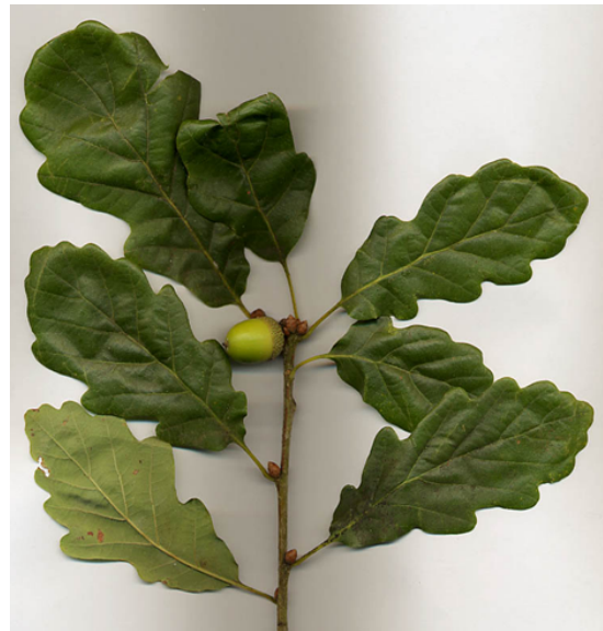
kocsánytalan tölgy hajtása

Az is biztos, hogy a kelták közismerten szoros kapcsolatot szőttek a fákkal. Hitük szerint az ember őse fa és írásuk jelkészlete is a fáktól ered. És a fák között is a tölgynek volt a legnagyobb tisztelete. Az égi istenek fájának tartották. De maradjunk a botanikánál, mert ha a tölgy mitológiájának mennénk utána, akkor még hosszú út állna előttünk, amit egy másik alkalommal érdemes végig járni. Ha meg nem bajlódunk ennyit a kelta néveredettel, akkor meg felcsapunk egy latin szótár, ahol a tölgy mellett a quercus kifejezést találjuk.