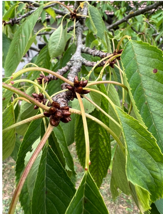
mirigyszemölcsök a levélnyélen

Virágzás után hajtanak ki egyszerűek levelei. Szélük fűrészes és ami a cseresznyére nagyon jellemző és amit földi halandó nem szokott nézegetni, a levélnyélen a levélváll közelében két vöröslő mirigyszemölcs látható, ami a fa fajáról árulkodik.