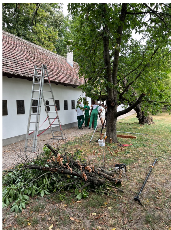
a levágott ágak csekély mértéke

Száraz ágak minden fán találhatóak. Egy fa gallyazása a faápoláshoz tartozó rutin feladat. De egy ilyen öreg fa esetében nagyon gondosan, a lehető legkevesebb élő gally levágásával kell végrehajtani.