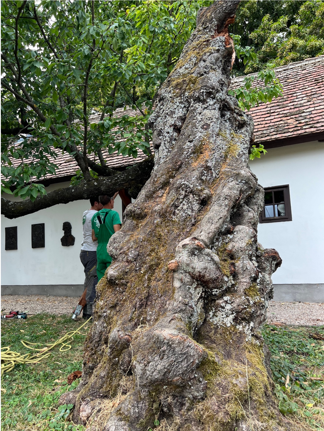
a fa művészin megformált törzse

törzse alacsony, így a koronaalap szemmagasságra esik. És ami meglepő és