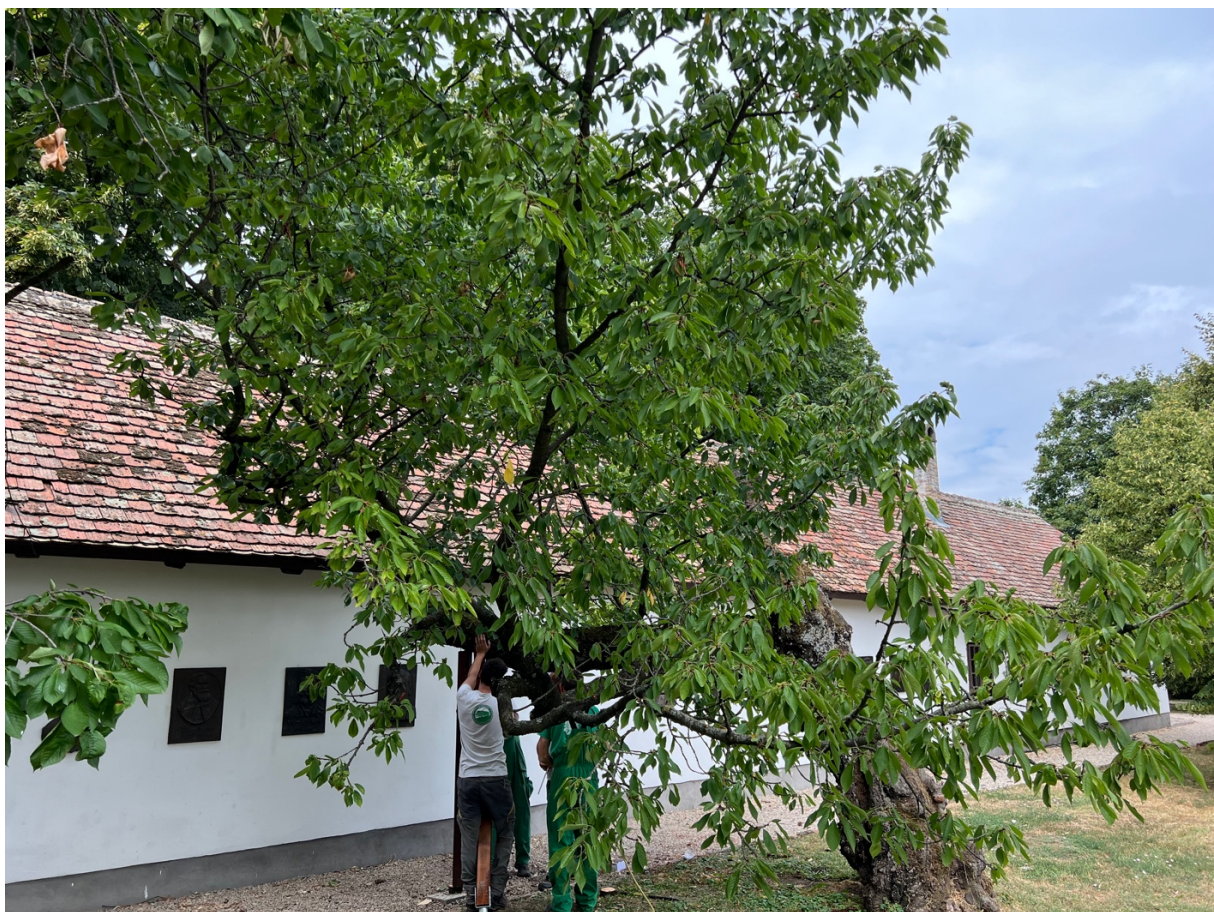
a Gárdonyi Emlékház a Gárdonyi Cseresznyefával