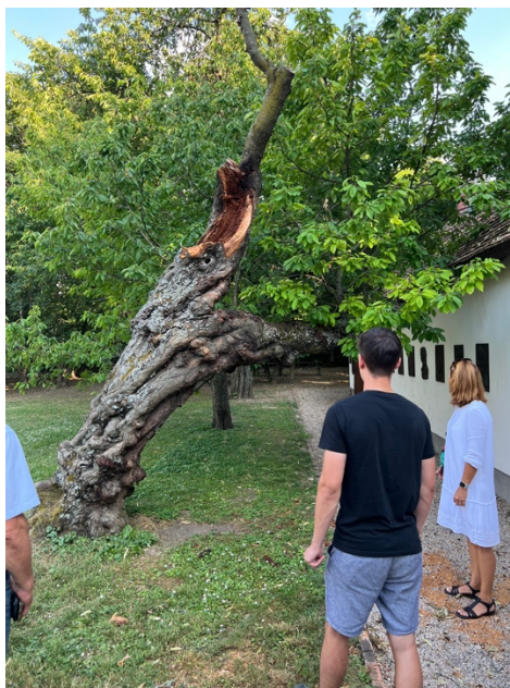
a fa felfedezése

az egyébként gondozott kert hangulatából. Egy gondos kertész nem tart meg egy ilyen semmirevaló fát! Koronája fénykorának már csak egy letűnt darabkája. Törzse erősen megdőlt, ráadásul az épület felé. Pontosan annak a falnak dől, ahol az irodalmárok domborművei sorakoznak. Egy ilyen cseresznyefát a kertészek már rég kivágtak volna és esetleg ültettek volna helyette másikat. De aztán kiderült, hogy öreg cseresznyét nem a gazdák gondatlansága kímélte meg a fűrész általi haláltól, hanem a Gárdonyi iránti tisztelet. A magyarázatot a Gárdonyi Kulturális Központ igazgató asszonyától kaptuk meg, aki éppen köszöntötte társaságunkat. Mesélte, hogy az öreg cseresznye is Gárdonyi emlékét őrzi. Képek vannak a Nadasdy birtok tanári lakjáról, abból az időből, mikor Gárdonyiék itt laktak és azon a cseresznyefa is látható. Ezért a helyiek úgy tekintenek a fára, mint Gárdonyi emlékfa.