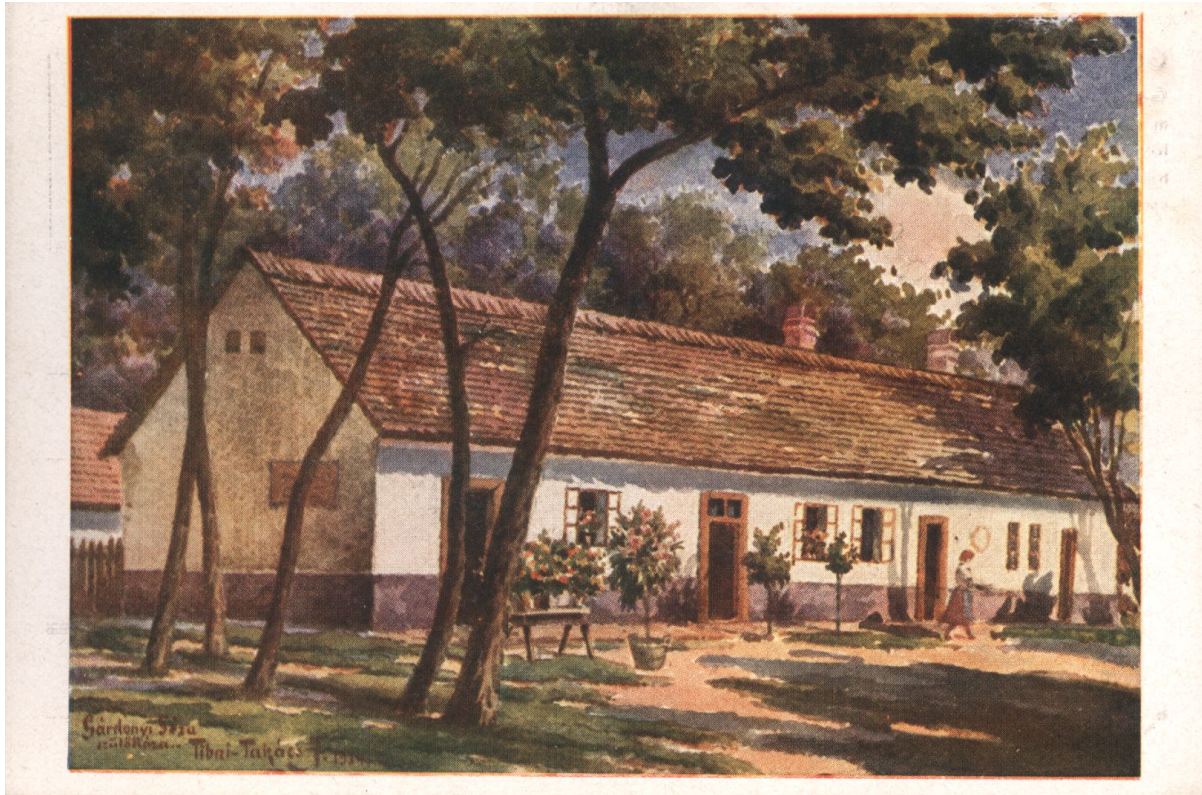
A Gárdonyi ház egy régi képeslapon