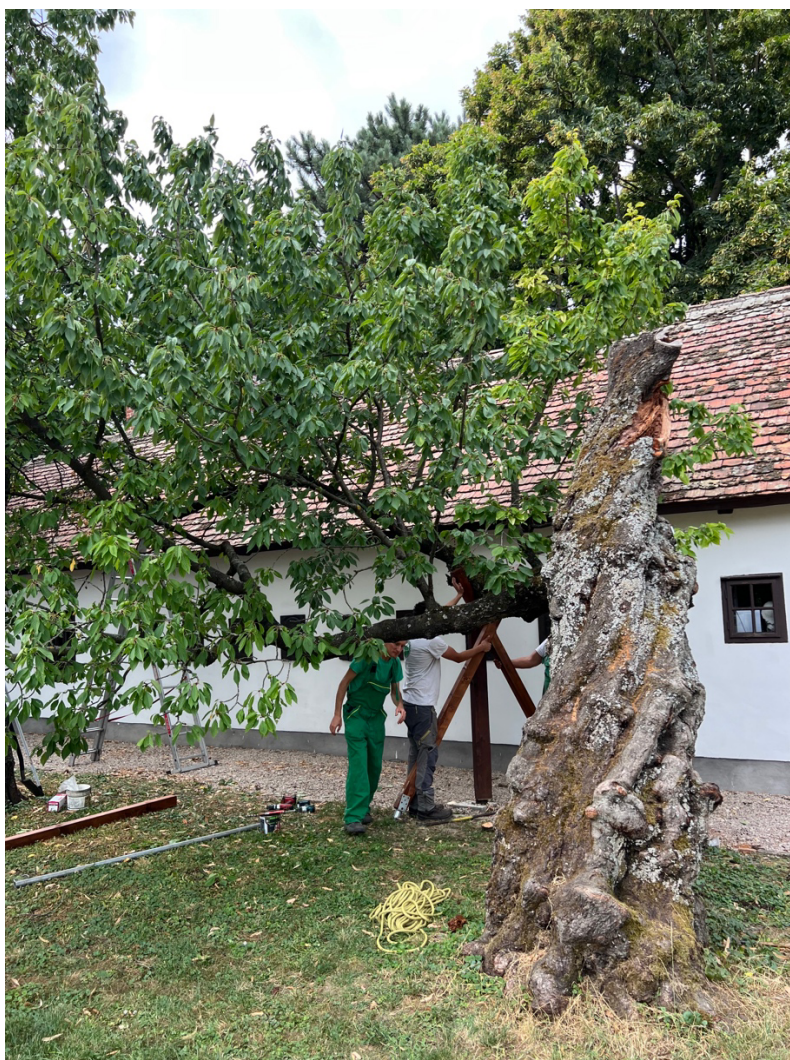
a Gárdonyi Cseresznyefa 2022-ben